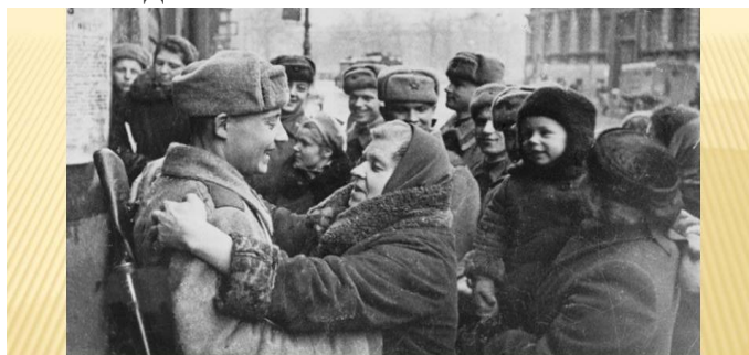
Прорыв блокады начался 12 января 1943 года. Окупанты сопротивлялись злобно и ожесточенно, а наша артиллерия и флот открыли ураганный огонь по врагу. 18 января блокада была прорвана. Еще больше года продолжались бои под Ленинградом. К 27 января 1944 года наши войска разгромили основные силы противника, продвинулись на 60 километров в глубину. Немцы начали отступать. 27 января 1944 года блокада была полностью снята.